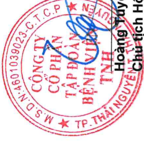
Hoàng Tuyên Chủ tịch Hội đồng Quản trị Ngày 25 tháng 01 năm 2025

Các thuyết minh kèm theo là một bộ phận hợp thành của báo cáo tài chính riêng này